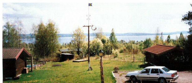
Utsikt över Siljan.