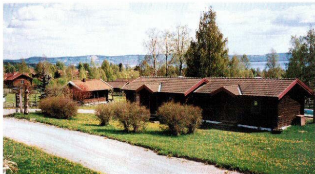
Välutrustade timmerstugor med utomhuspool.